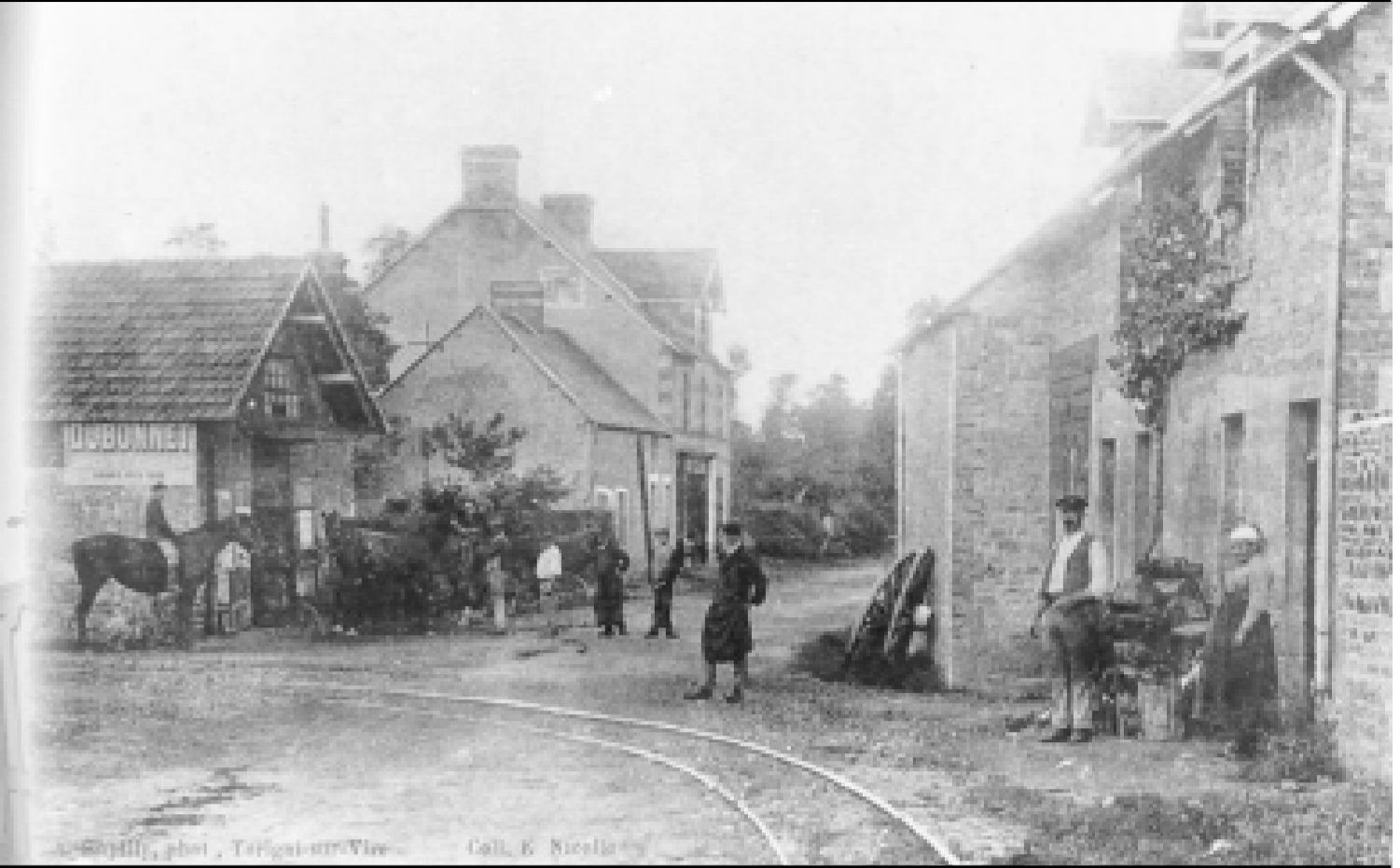
L'arrivée du tramway