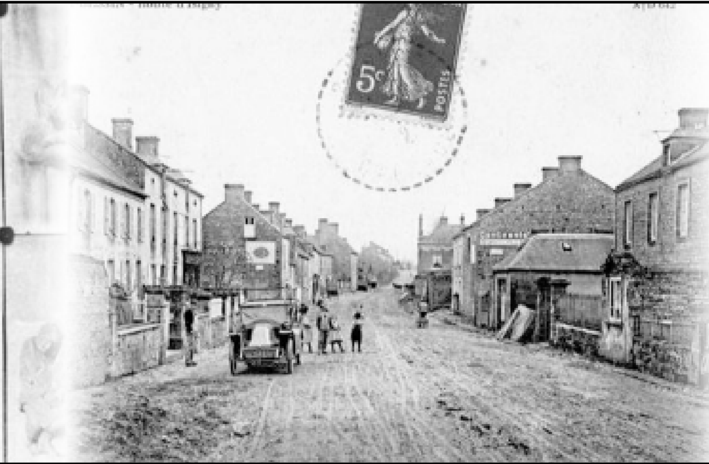
Le village coupé par la route Caen-Cherbourg