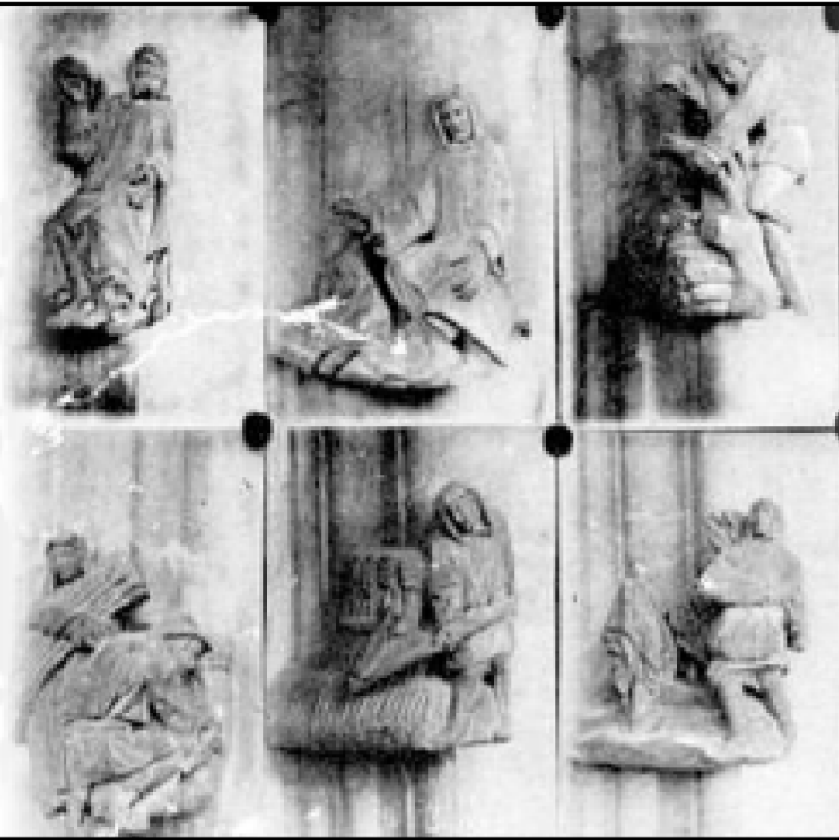
Le calendrier en pierre