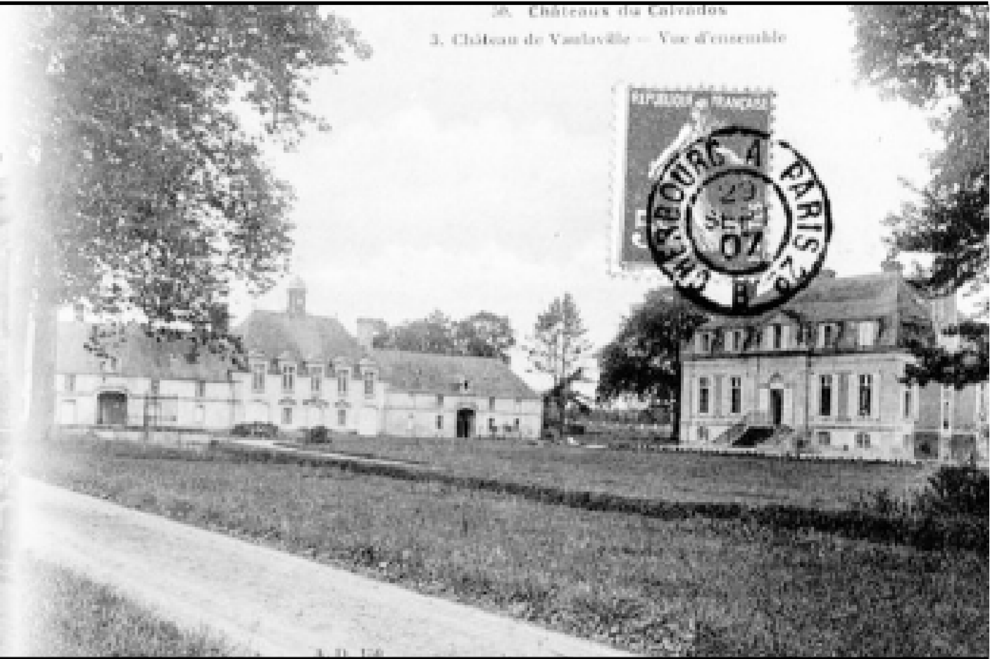
Le château et ses imposants communs