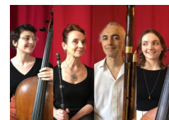
Les Muses en Famille

« Musiques à la cour » : Musique de chambre dans les cours d'Europe au Grand siècle. Purcell, Young, Platti, Forqueray, Schickhardt, Telemann