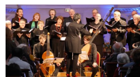
La Fugue et Compagnie

Œuvres vocales et instrumentales de J.S. Bach, Vivaldi, Marcello