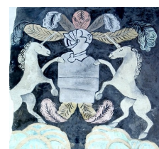
Litre seigneuriale de l'église de Vouilly